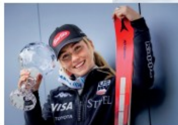
MIKAELA SHIFFRIN, USA